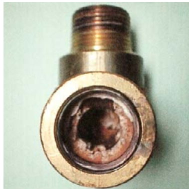
【スケールの堆積した温調機配管】 密閉式クーリングタワー回路で 6か月間使用後の真鍮管。