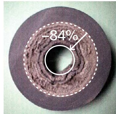
【スケールの堆積した塩ビ配管】 開放式クーリングタワー回路で 5年間使用後の塩ビ配管断面。