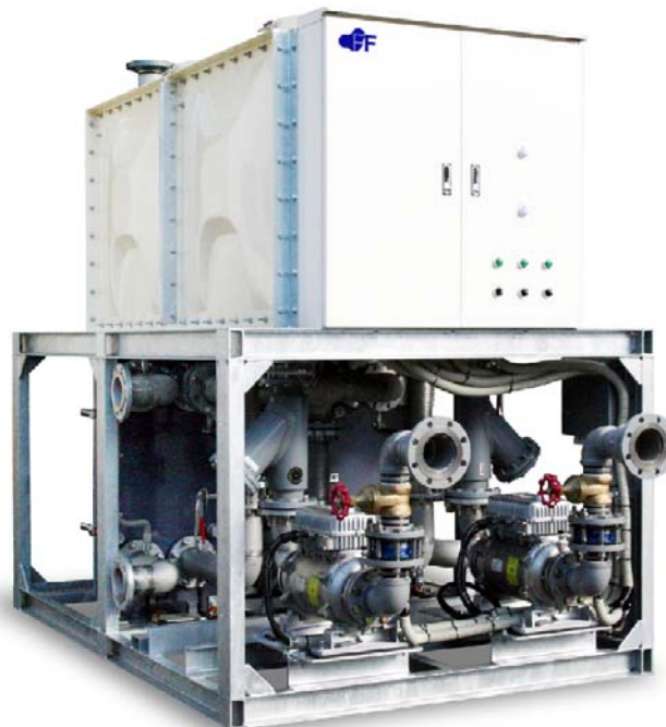
【Fig-03 UWT二次冷却ユニット】